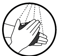
Se laver régulièrement les mains