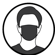
Port du masque

Les attroupements et les croisements sont limités autant que possible.