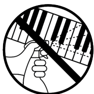
Ne pas nettoyer les claviers avec du gel